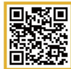
237 선교망대 신청